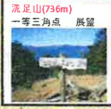
洗足山(736m) 一等三角点 展望