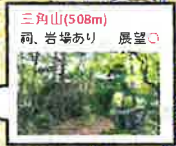
三角山(508m) 祠、岩場あり 展望○

A コース 集合場所(用瀬町総合支所) ルート:用瀬町総合支所→女人堂→三角山(昼食)→景石城跡→用瀬町総合支所