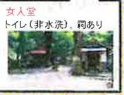
女人堂 トイレ(非水洗)、祠あり