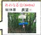
おおなる山(648m) 樹林帯 展望○