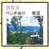
展望台 ベンチあり 展望