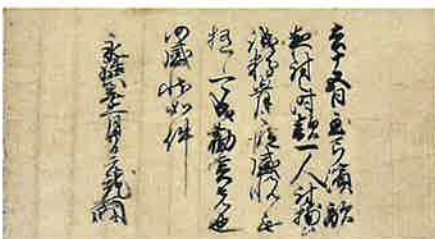
毛利元就感状(「山口博物館所蔵文書」/山口県立山口博物館所蔵)