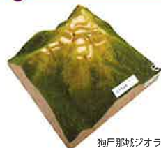
狗戸那城ジオラマ

県内に多数残されている山城を、県埋蔵文化財センターの最新の研究成果をもとに紹介します。城郭の空撮動画も放映予定です。