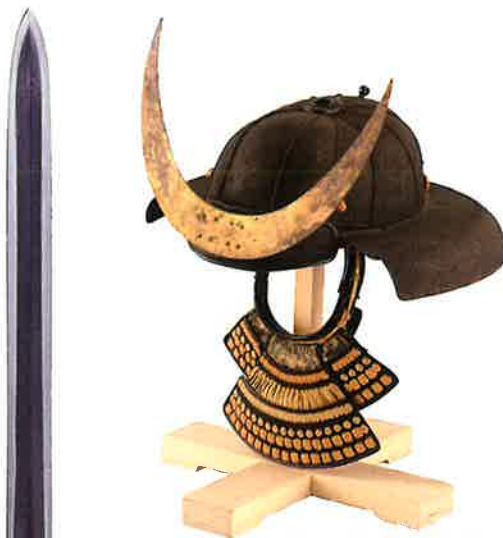
鉄鎧十二筋兜(吉川史料館所蔵)