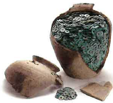
下坂本清合遺跡出土埋蔵銭(鳥取県埋蔵文化財センター所蔵)