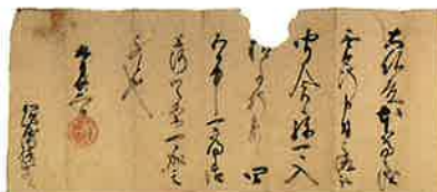
豊臣秀吉朱印状(鳥取加須屋家文書/個人蔵)