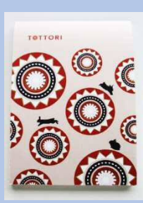
TOTTORI特製ミニメモ帳 (しゃんしゃん傘)