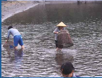
【無形民俗文化財】 鳥取市気高町睡蓮のついで突き (ため池における魚休籠らついで漁)