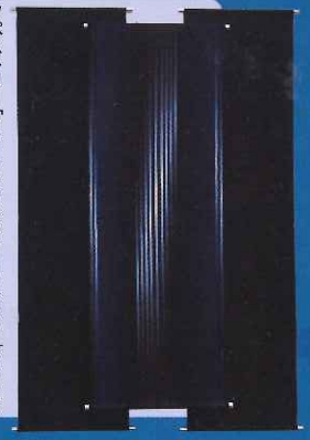
タペストリー「a streak of light」2017 新匠工芸会展覧本賞受賞