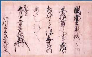
【保護文化財】 北川家文書 「山名豊頼知行宛行状」 個人(鳥取市歴史博物館寄託)