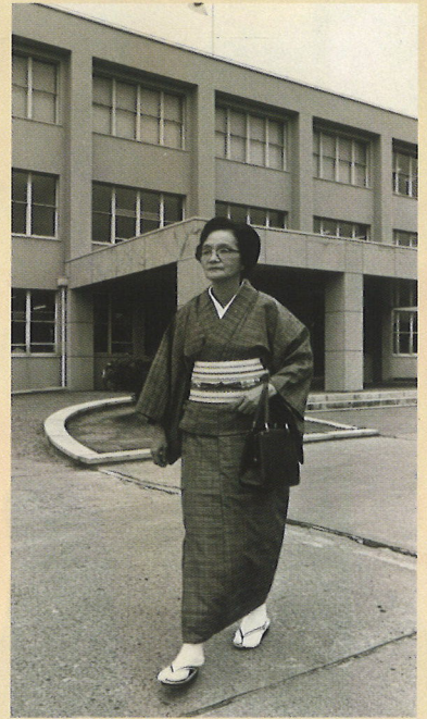
鳥取地方裁判所前