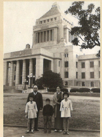
国会議事堂前の家族写真