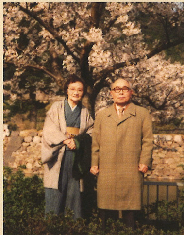
お堀端で夫とお花見昭和57年4月4日