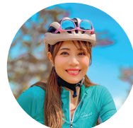
自転車系 YouTuber あむちゃん!