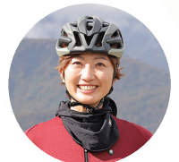
自転車系 YouTuber おおやようこ