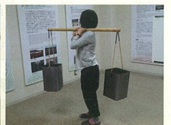
砂丘での水やり 重さ体験