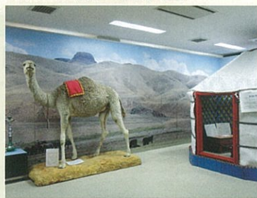
モンゴルゲル内部