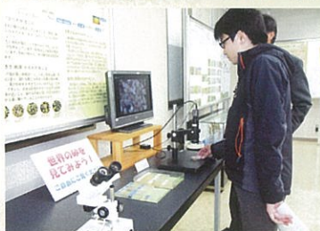
世界の砂も観察できます