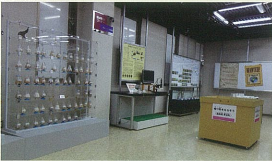
乾燥地の伝統的な水利用・ カナートの模型