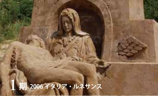
1期 2006 イタリア・ルネサンス