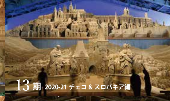
13期 2020-21 チェコ & スロバキア編