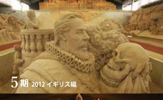
5期 2012 イギリス編