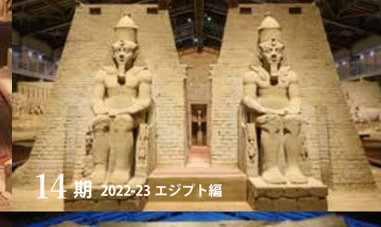
14期 2022-23 エジプト編