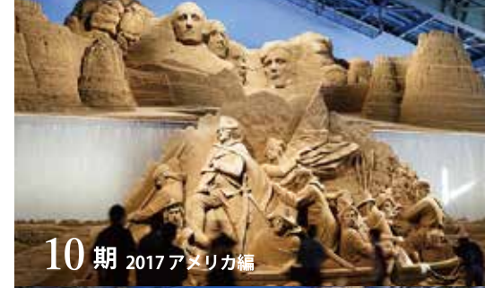
10期 2017 アメリカ編