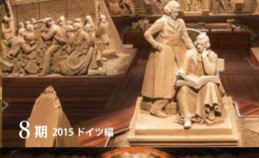
8期 2015 ドイツ編