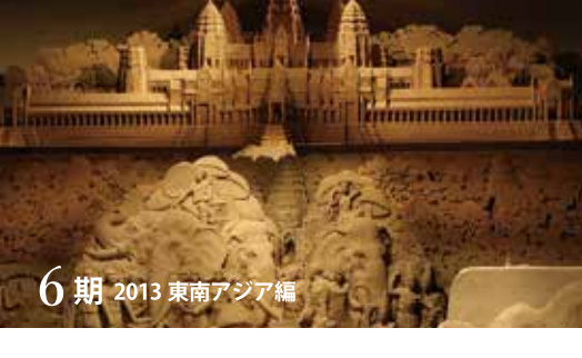
6期 2013 東南アジア編