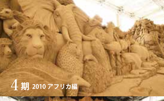
4期 2010 アフリカ編