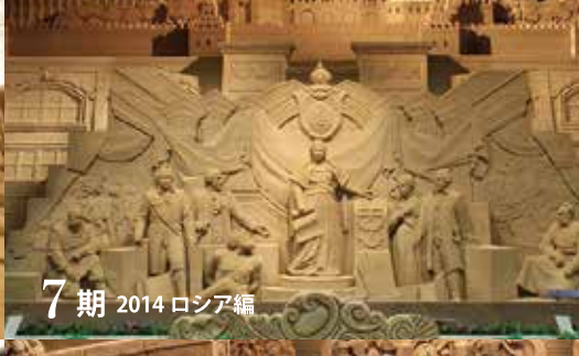
7期 2014 ロシア編