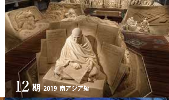
12期 2019 南アジア編