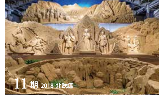
11期 2018 北欧編