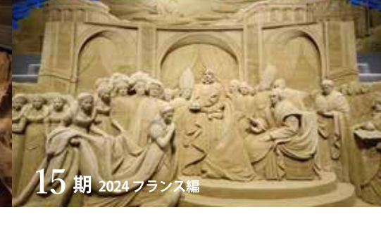
15期 2024 フランス編