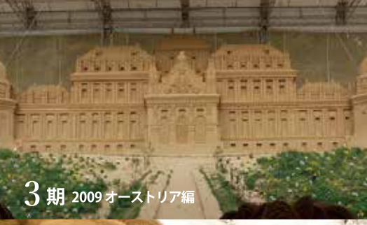
3期 2009 オーストリア編