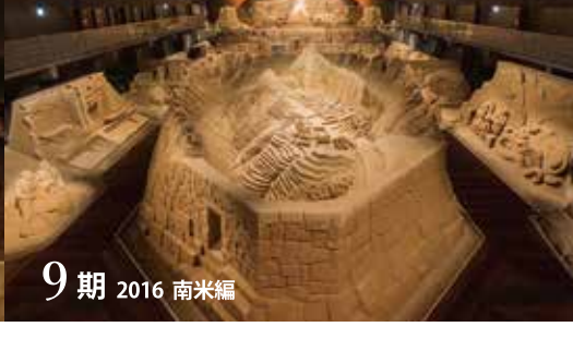
9期 2016 南米編