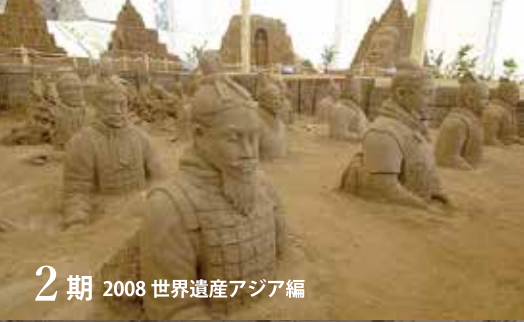
2期 2008 世界遺産アジア編