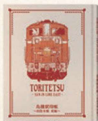
鳥鐵駅印帳～山陰本線・東編～ ¥1,650(税込)