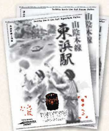
鳥鐵駅印～山陰本線・東編～ (14種) 各¥300(税込)