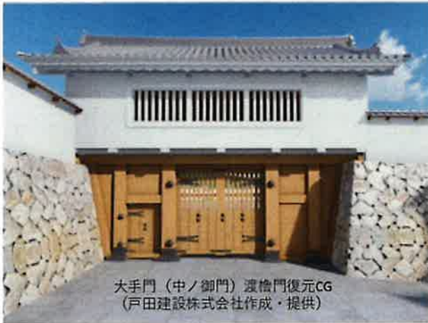
大手門（中ノ御門）渡櫓門復元CG （戸田建設株式会社作成・提供）