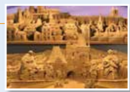
↑鳥取砂丘 砂の美術館 第14期展示「砂で世界旅行 エジプト編」

鳥取駅 (15分) 鳥取砂丘(砂の美術館) (20分) 浦富海岸めぐり遊覧船 (15分) 城原海岸 (5分) 海と大地の自然館 (15分) 鳥取駅 (35分)