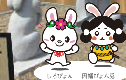
しるりぼん 因幡びよん兔

白い砂の浜が弓なりに連なり美しい白兔海岸。近くには国の天然記念物ハマナスの群落もみられます。