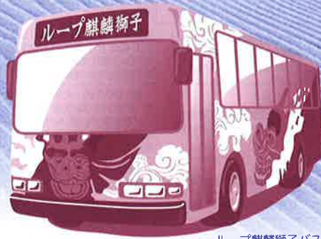
～ループ麒麟獅子バス～