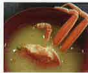
★親がに半身入りに汁