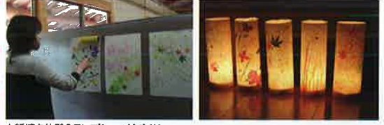
★紙漉き体験&ランプシェードづくり