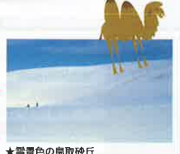
★雪景色の鳥取砂丘